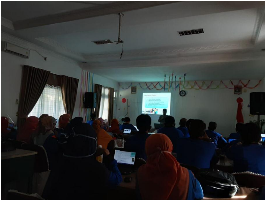
Gambar 1. Sosialisasi Pembelajaran Kepada Guru