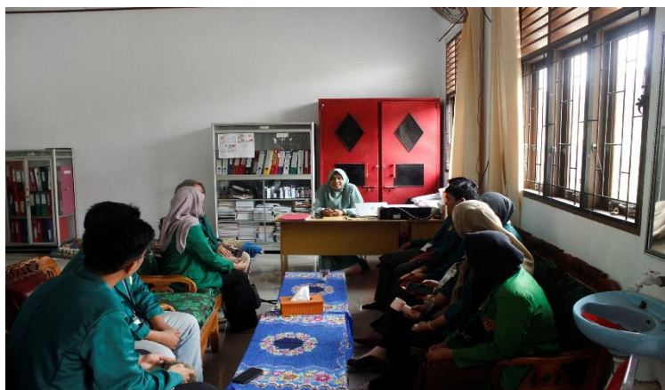
Gambar 2. Wawancara dan Observasi

Temuan ini lebih efektif dibandingkan pengabdian berbasis sosialisasi lingkungan tanpa praktik langsung sebagaimana dilaporkan oleh [13], yang menunjukkan peningkatan kesadaran siswa namun belum diikuti oleh perubahan perilaku nyata. Dalam kegiatan ini, hasil pembelajaran dapat diamati secara langsung melalui berkurangnya sampah organik dan meningkatnya keterlibatan siswa dalam pengelolaannya. Hal ini menegaskan bahwa penggunaan media pembelajaran yang berbasis realitas lingkungan sekolah mampu meningkatkan literasi ekologi sekaligus partisipasi aktif siswa.