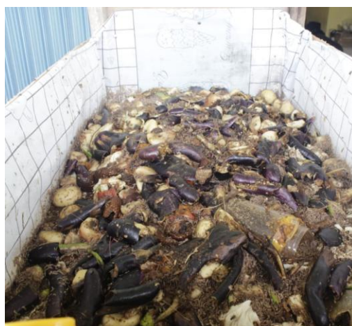
Gambar 4. Pemilahan Sampah Organik Untuk Pakan maggot

Selain itu, pemilihan budidaya maggot sebagai media pembelajaran terbukti efektif karena karakteristik biologisnya yang mampu mengurai sampah organik dalam waktu singkat. Proses ini tidak hanya menarik bagi siswa SMP, tetapi juga relevan dengan permasalahan lingkungan yang mereka hadapi sehari-hari. Hal ini sejalan dengan pendapat [13] bahwa penggunaan media pembelajaran yang berbasis realitas lingkungan sekitar dapat meningkatkan literasi ekologi dan partisipasi siswa secara keseluruhan. Temuan dalam penelitian ini juga menunjukkan ukuran efek yang sangat besar ( d = 2.38 ), yang menandakan bahwa intervensi tidak hanya meningkatkan pengetahuan, tetapi juga memengaruhi cara berpikir dan sikap siswa terhadap pengelolaan sampah.