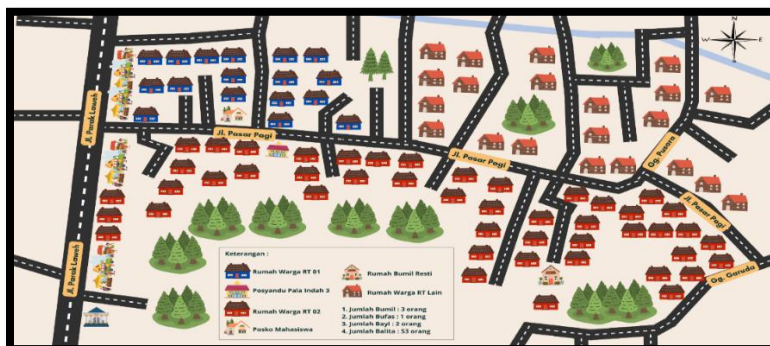
Gambar 2. Denah RT 01 dan RT 02